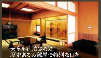
天皇も宿泊された 歴史あるお部屋で特別な日を