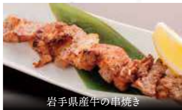
岩手県産牛の串焼き

お肉をもう少しというお客様におすすめです。岩手県産牛の旨味をお楽しみ下さいませ。