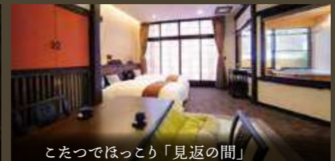
こたつでほっこり「見返の間」