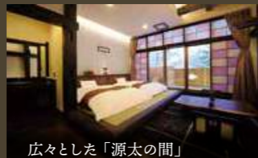
広々とした「源太の間」